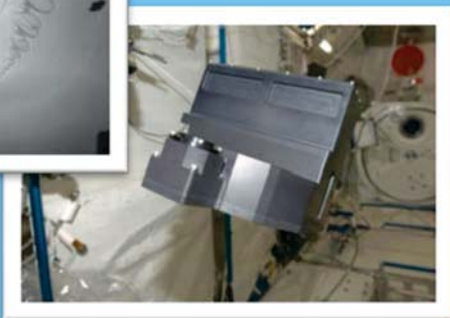
宇宙空間での氷結晶成長実験